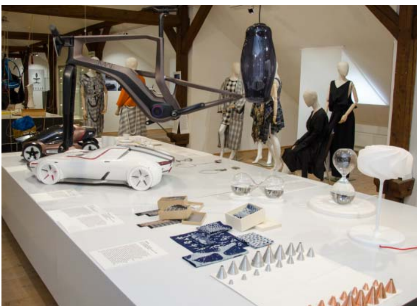
V kategórii študentský dizajn postúpili (zľava) EMWE e-bike, kolekcia vreckoviek Čakanka či MATRIOŠACH