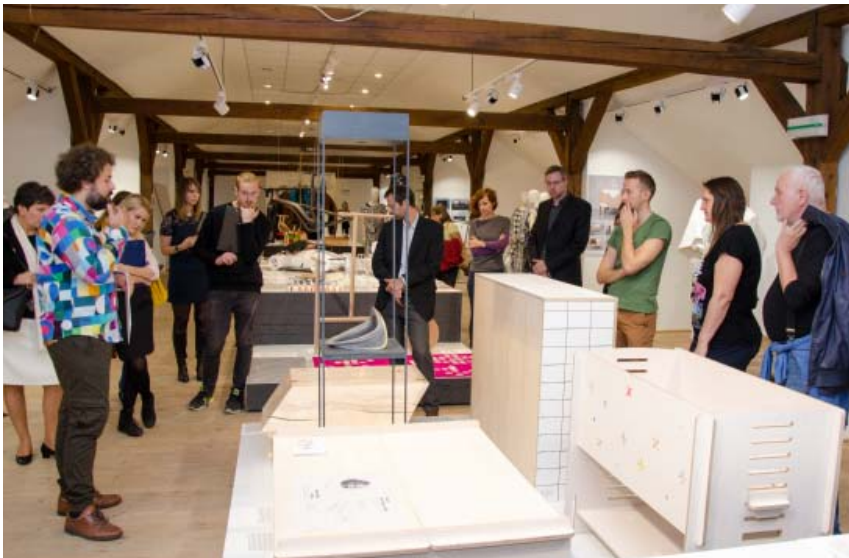
V kategórii dizajn s pridanou hodnotou postúpili (zľava) Konferenčný stôl material basic N 48.1355826, E 17.1053624, komoda Panelák či multifunkčný drevený nábytok KUKO.